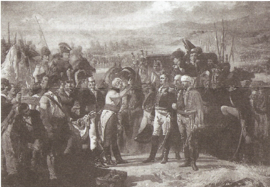
La rendición de Bailén, de Casado del Alisal